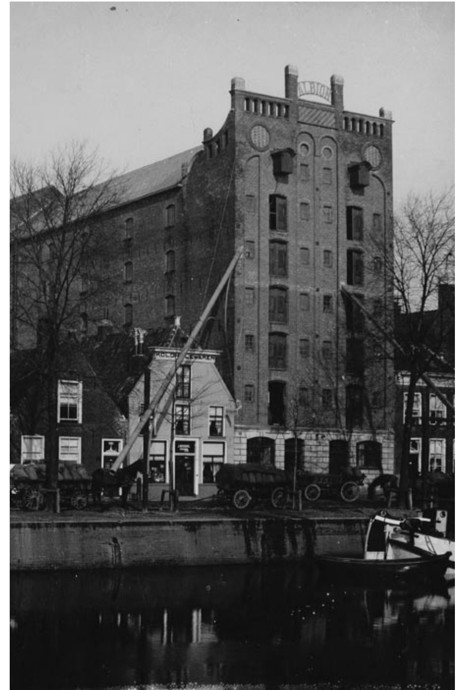
Graanpakhuis Albion, Noorderhaven N.z., Groningen, 1910