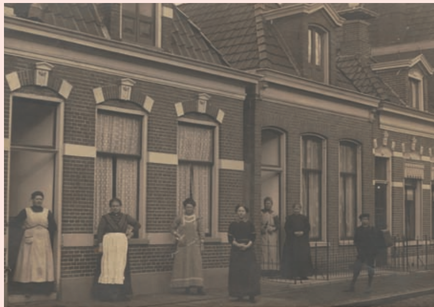
Brandenburgerstraat 5-9, Groningen, ca. 1915 Foto S. Sanders & Zn., collectie RHC Groninger Archieven (2437-917)

> Memories van successie, 1806-1927: Zie hoofdstuk 9. De jaren 1812-1813 zijn niet bewaard gebleven.