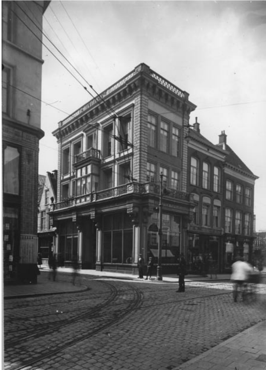
Herestraat 1 - Tussen beide Markten 2-4, Groningen, 1922