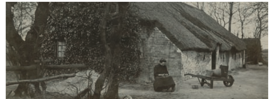
Boerderij in Opende, 1913.

Qua omvang en bestaansperiode vertonen de waterschapsorganisaties in Groningen, ook wel zijlvesten of dijkrechten genoemd, een grote variatie. Een aantal organisaties ontstond al in de Middeleeuwen, op initiatief van kloosters. Andere waterschappen zijn veel later pas ontstaan. Zo kan het gebeuren dat in het ene waterschapsarchief middeleeuws materiaal te vinden is, terwijl andere slechts archiefstukken uit de 18e en 19e eeuw bevatten. Om een overzicht te krijgen is het raadzaam om de inventarissen van deze archieven te bestuderen. Deze archieven berusten deels bij de Groninger Archieven (Waterschap Noorderzijlvest en rechtsvoorgangers) en deels bij het Waterschap Hunze en Aa's.