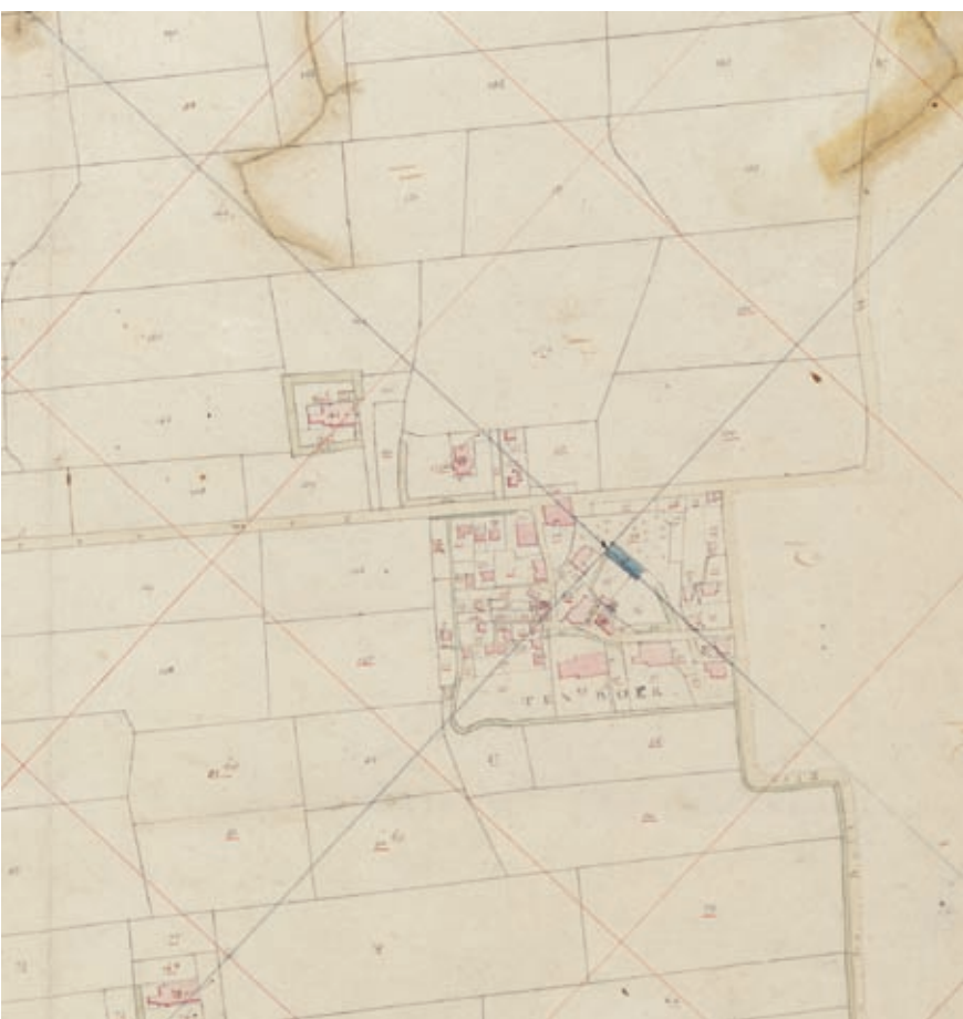
Kadastraal minuutplan van Ten Boer, sectie A, 1832. Collectie RHC Groninger Archieven (44-935).

van percelen en objecten en de veranderingen daarin visueel zijn weergegeven. De kadastrale boekhouding is te raadplegen met behulp van de Kadaster Archiefviewer in de studiezaal (zie kader pag. 129).