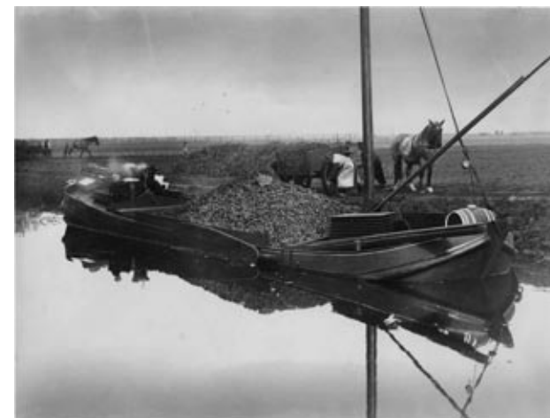
Aardappeloogst, Veenkoloniën, ca. 1900