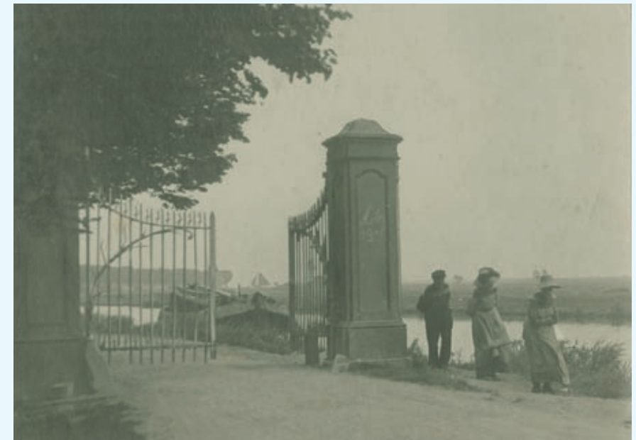
Langs het tolhek bij Gideon aan het Winschoterdiep, ca. 1910

> www.maritiemdigitaal.nl - gezamenlijke online database van een aantal maritieme musea in Nederland, met beschrijvingen en foto's van museale objecten en bibliotheekcatalogi.